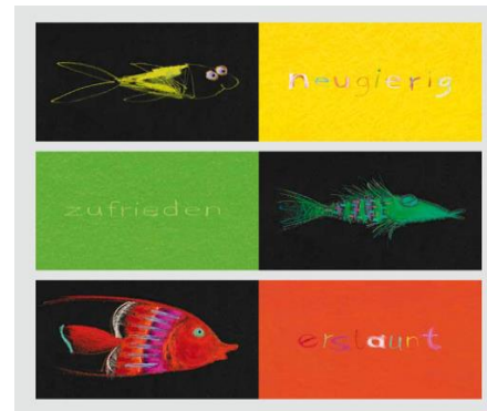
Mies van Hout: Heute bin ich